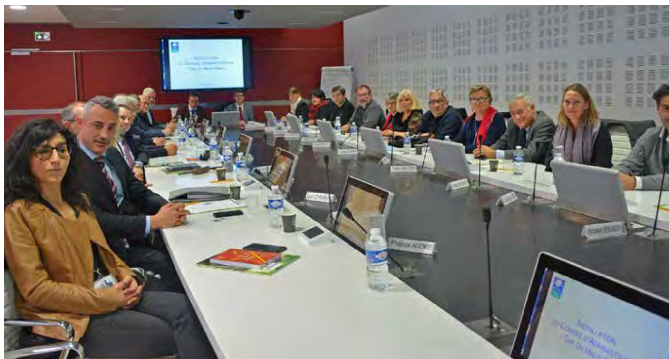
Conseil d'Administration de la CAF 68